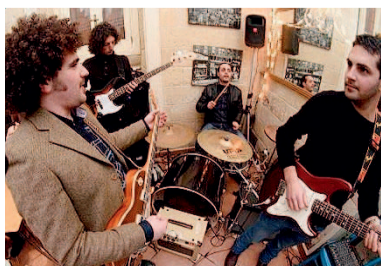
SUL PALCO La band dei Crickets