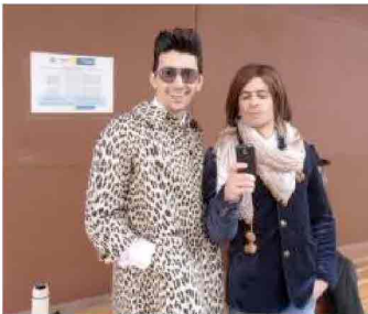
I SOLITI IDIOTI GLI OMOSESSUALI

Seconda cosa. Certo che tra "Scialla!" e "I soliti idioti" preferisco il primo. Ma non scrivo, come mi metti in bocca tra virgolette per ironizzare, che «li si che la volgarità è usata bene». Scrivo una cosa diversa, senza scandalizzarmi per nulla delle battute colorite e truci di Mandelli-Biggio, cioè questa: «Una certa volgarità fa parte del gioco se la sai usare. Vedere per credere "Scialla!" di Francesco Bruni, dove lo slang giovanile romano detta legge». Mi pare un concetto diverso. Meno brutale. Più sottile. Ciao Michele Anselmi