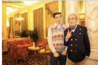
I SOLITI IDIOTI