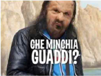
I SOLITI IDIOTI IL MAFIOSO

Sempre Wired dà notizia di altri sezionatori di rane. Per esempio, un convegno organizzato lo scorso gennaio a San Antonio, Texas (e già la cosa un po' fa ridere) dalla Mind Science Foundation. Li abbiamo scoperto che gli psicologi che studiano i meccanismi della risata e l'alchimia della battuta di spirito sono trattati dai colleghi che studiano invidia, gelosia, odio e amore come parenti poveri. Abbiamo saputo che fanno esperimenti con gli spinelli. E' vero che con un po' di marijuana una barzelletta fa più ridere? Entrino i volontari per l'esperimento (astenersi chi non inala il fumo).