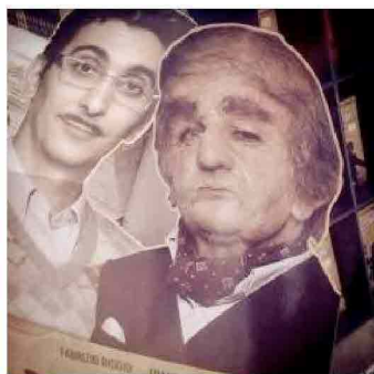
I SOLITI IDIOTI