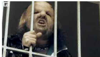
I SOLITI IDIOTI IL MAFIOSO

Prima cosa. Vedi, Mariarosa, io non mi rammarico affatto che i giovani facciano la fila ai multiplex, che non trovo una parolaccia con la ics: ognuno va a vedere i film che vuole, ci mancherebbe, mi limitavo solo a descrivere il tipo di richiamo collettivo/generazionale innescato dal film, senza giudizio morale, del resto ridicolo. E di sicuro, per la piccola storia politica che mi porto dietro, non preferisco vedere i ventenni allenarsi in piazza, specialità lancio dell'estintore. Dici questo a uno che ha lavorato 24 anni a "l'Unità" e tra lo Stato e le Br ha scelto sempre e solo lo Stato. Che cosa c'entrano i vandali di piazza San Giovanni con il film? Hai davvero quest'idea di me?