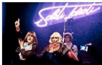
I SOLITI IDIOTI

Era la damigella grassa in "Le amiche della sposa" di Paul Feig, fissata con il passeggero del sedile accanto che lei credeva un agente sotto copertura, e il dettaglio contribuì all'arrazzamento: "Lo voglio scalare come un koala fa con l'albero (nella vita, l'attore Ben Falcone è suo marito). E' la Molly della serie "Mike e Molly" commedia romantica di Mark Roberts dove i piccioncini si incontrano ai Grassoni Anonimi, uniti dalla fede: "Ogni mattina mi inginocchio e prego: Dio, aiutami a seguire la dieta, e poi aiutami a rialzarmi". Ha idee precise sulla comicità sgradevole, che a lei piace fare e a noi piace guardare: "E' come innamorarsi di qualcuno che ai più fa venire la pelle d'oca, ma noi lo adoriamo".