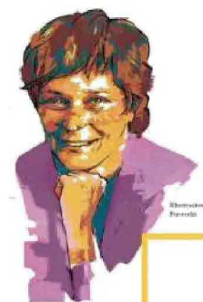
MANCUSO GETCONTENT ASP JPEG