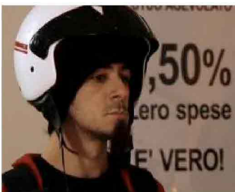
I SOLITI IDIOTI

Stiamo sui numeri, è meglio. Qualcuno ha contato i "Dai, cazzo", trovandone una quantità esagerata. Pare siano 148 in un'ora e mezza di film, più di uno al minuto. Ma, di grazia, la coatta Sabbry di Luciana Littizzetto, detta anche "Minchia Sabbry", non marciava allo stesso ritmo? Per scrupolo, e per non dir scemenze, abbiamo fatto una verifica (i controlli sono la chiave del successo, spiega in "Checklist" Atul Gawande, da Einaudi) In uno sketch di 2 minuti e 47, applausi compresi, a "Cielito Lindo", di minchie ne abbiamo contate quindici. Media un po' più alta, anche senza bisogno di calcolatrice.