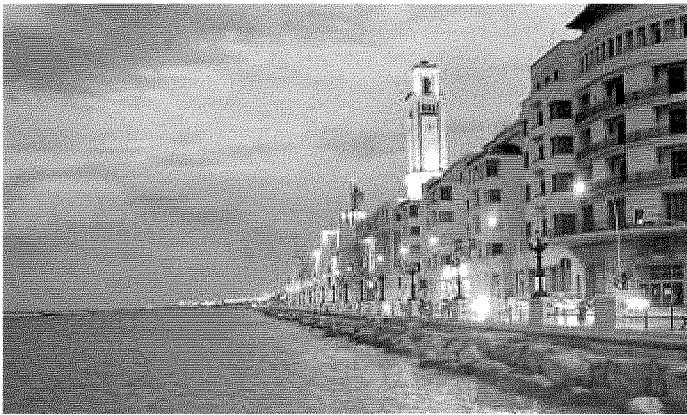
LA COPPIA In alto, Ridge e Brooke, la coppia sulle cui vicissitudini sentimentali si regge buona parte della trama di «Beautiful». A sinistra il Lungomare di Bari