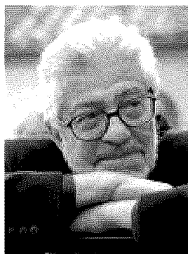
ETTORE SCOLA Presidente Bif&st