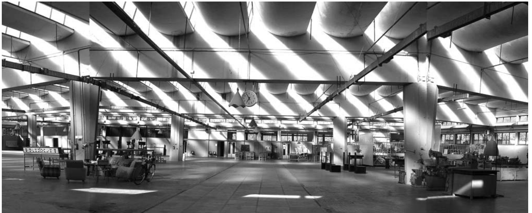
L'interno delle Manifatture Knos di Lecce: quattromila metri quadri dove saranno ricavati i 250 metri quadri da destinare al cineporto che sarà gestito dalla Apulia film commission in collaborazione con l'associazione «Sud Est»

«Questa nuova struttura, quando andrà a regime - spiega Iarussi - costituirà uno dei