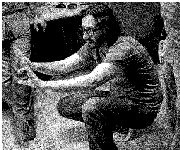
SUL PODIO Daniele Vicari, regista di «Diaz»