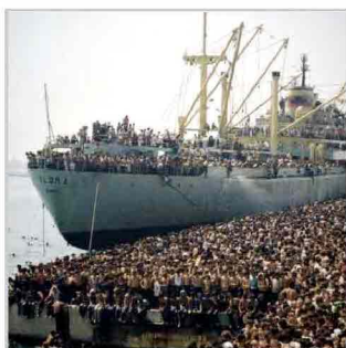
La nave dolce