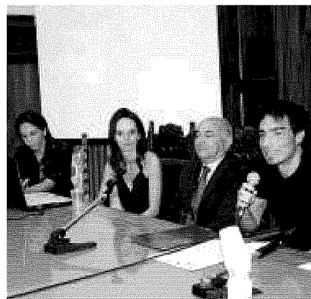
EFFETTO PARADOSSO La presentazione del film ieri a Palazzo Dogana con buona parte del cast

film ha un cameo; di buona parte del cast del film e di qualche esponente delle maestranze tecniche; del rappresentante dell'Apulia Film Commission, il giornalista Enrico Ciccarelli