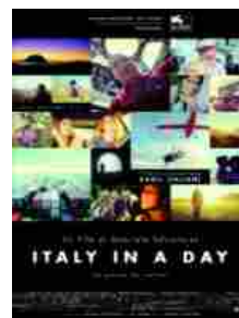
Italy in a Day