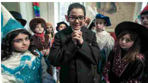
30/05/2014 Virzi domina le candidature ai Nastri d'argento