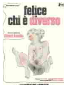
Felice chi è diverso