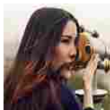
Sponsor (4WNet) 04/03/2015 Migliora il tuo inglese! Studia inglese con EF e vola verso un futuro internazionale