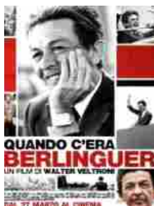
Quando c'era Berlinguer