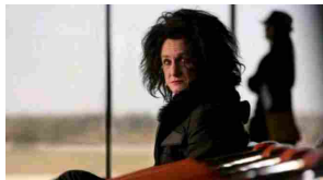
01/07/2012 Sorrentino vince ai Nastri d'Argento 2012