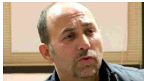
27/07/2007 Ferzan Ozpetek