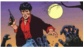
28/11/2014 Esclusiva: Tiziano Sclavi, l'anima tormentata di Dylan Dog