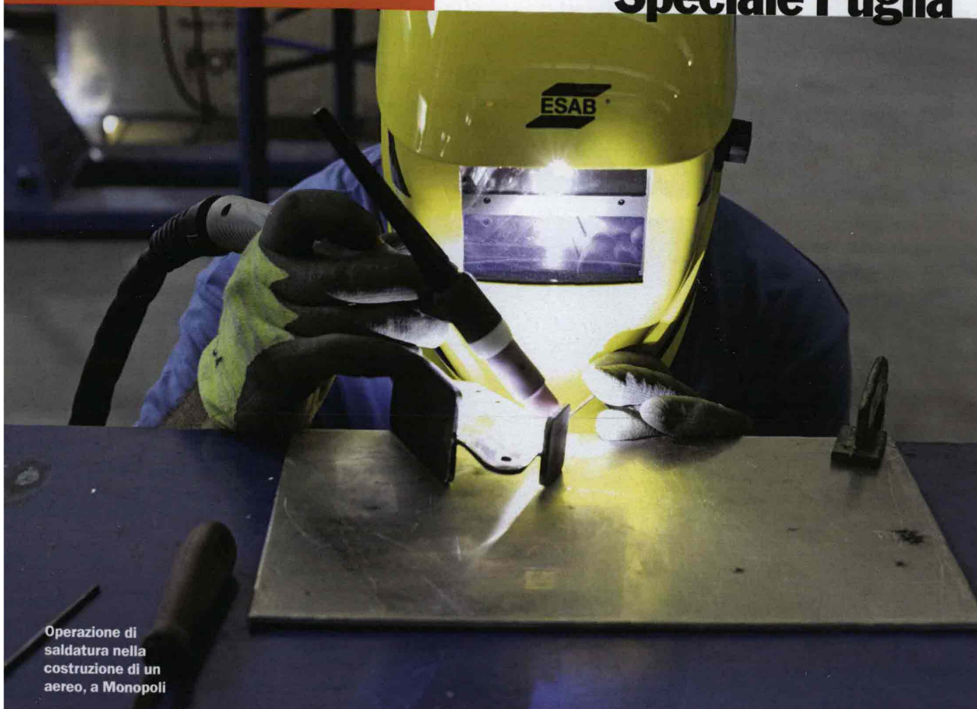
Operazione di saldatura nella costruzione di un aereo, a Monopoli