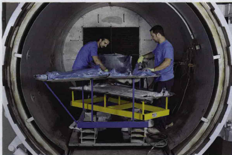
LE SINGOLE PARTI DEL VELIVOLO SOTTOPOSTE AL "CICLO DI CURA IN AUTOCLAVE"