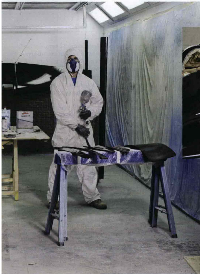
ADDETTI ALLA VERNICIATURA. SOTTO: L'ASSEMBLAGGIO DELLE ALI DI UN AEREO BLACKSHAPE