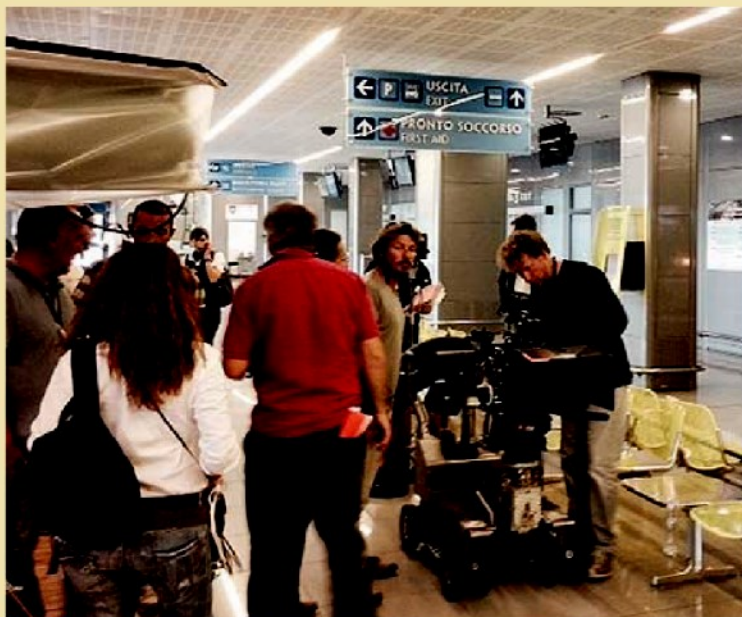
CIAM Le riprese del film «La vie très privée de monsieur Sim»