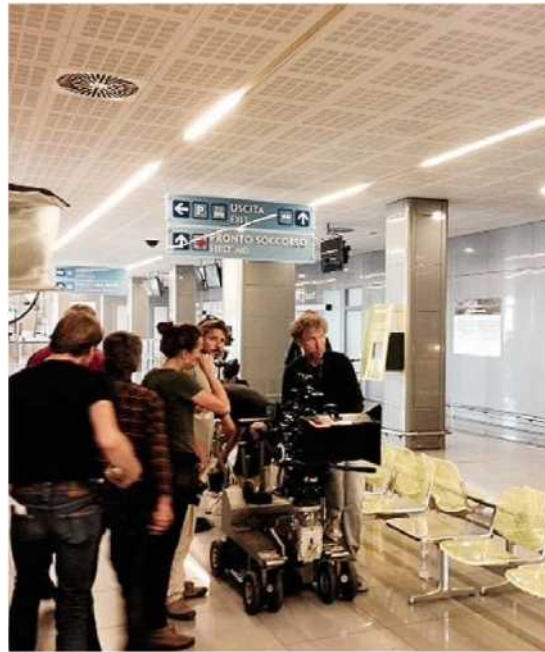
CIAK IN AEROPORTO Due momenti delle riprese effettuate ieri all'interno dell'Aeroporto del Salento