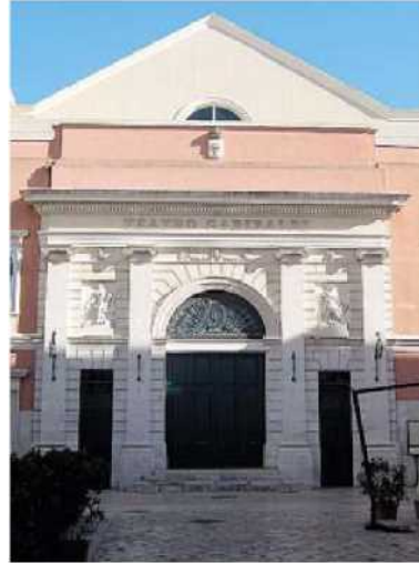
BISCEGLIE Il teatro Garibaldi