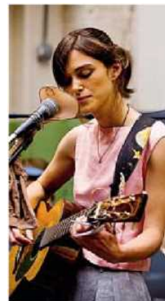
L'ATTRICE Keira Knightley interpreta con Mark Ruffalo e Adame Levine il film di Carney

Il film di Carney offre una sua personale visione di New York, con una storia che racconta il potere della musica, in grado di cambiare la vita e il destino di due persone in difficoltà. Il produttore musicale Dan Mulligan sta attraversando un momento difficile, con un matrimonio che sta andando in pezzi, una carriera in declino e una figlia con la quale non riesce a comunicare. Ma nel momento di massimo sconforto sente per caso una bellissima canzone di Greta, musicista sconosciuta sul punto di mollare il proprio sogno di fare musica a causa di una grande delusione e di un'inattesa separazione. Una copia improbabile, quindi, che nasce da un mix di ispirazione e disperazione; un rapporto che da partnership musicale diventerà una profonda amicizia che trasformerà completamente la loro vita.