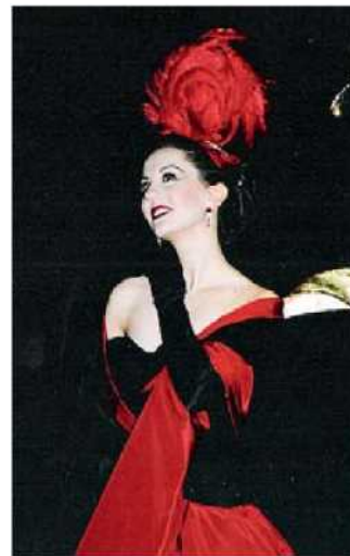
IL 12 DICEMBRE Al Petruzzelli

Continua intanto alla Camerata la campagna abbonamenti per l'intera stagione e per la linea «Eventi» di soli dieci appuntamenti momenti di musica, danza e jazz. Info 080.521.19.08 o sul sito internet www.cameratamusicalebarese.it .