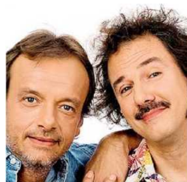
FOGGIA A TEATRO Sopra Marisa Laurito, protagonista del primo spettacolo e accanto Gianluca Guidi e Giampiero Ingrassia, in scena a marzo