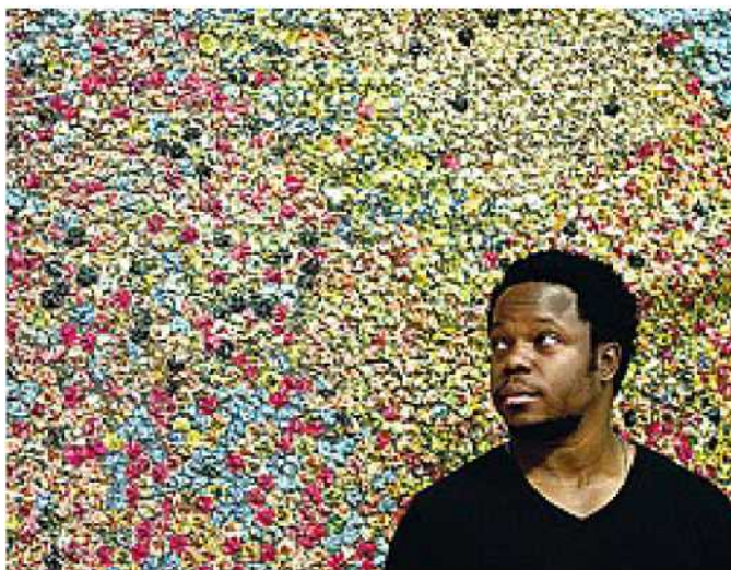
Il trombettista americano Ambrose Akinmusire suonerà a Bari il 2 maggio

Il primo spettacolo che inaugura la stagione il prossimo 11