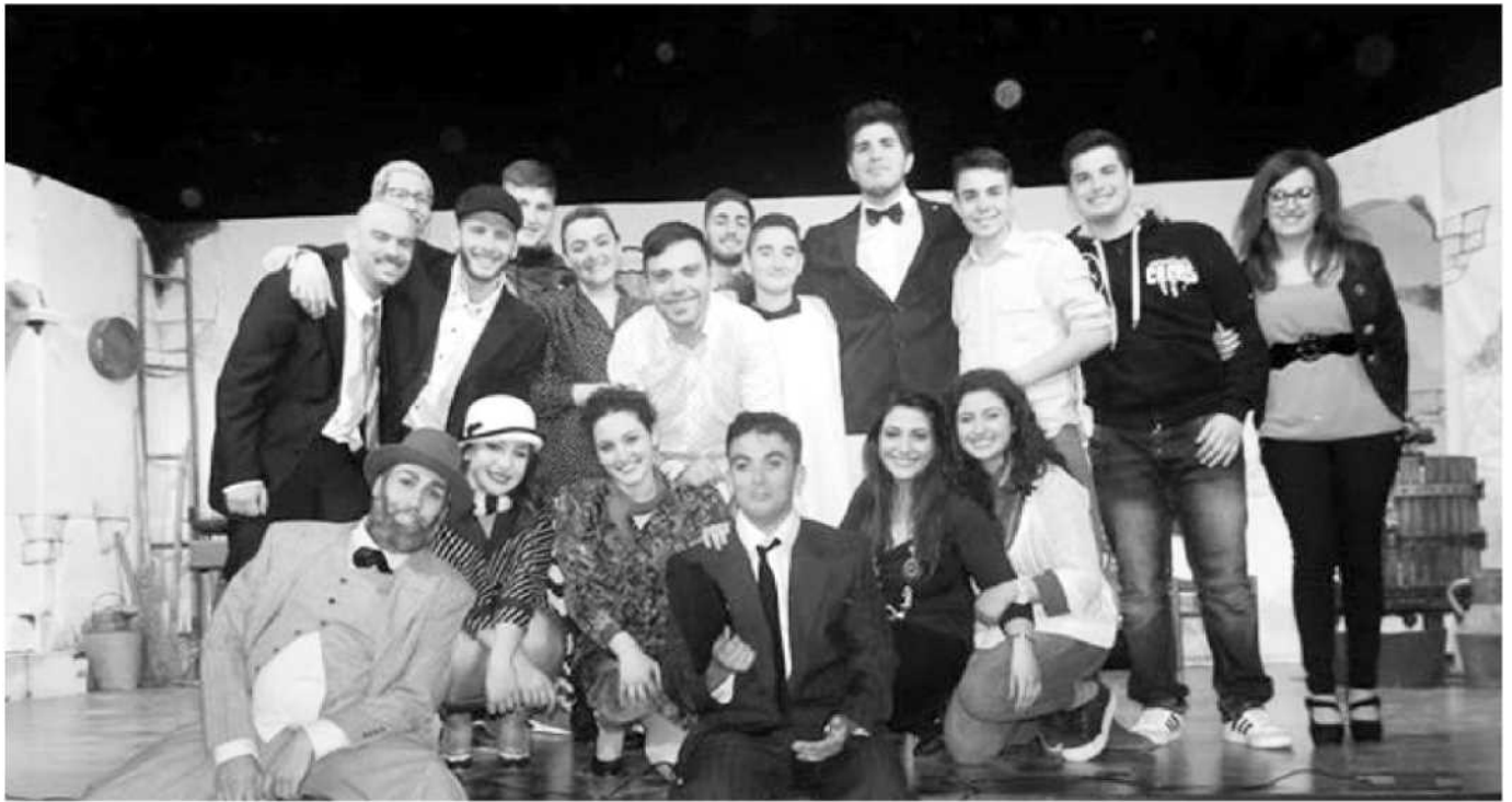
La compagnia "De... mentibus"