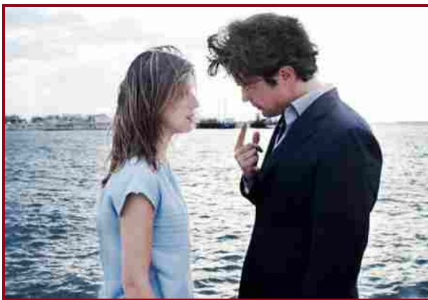
La prima luce di Vincenzo Marra

La prima luce è il nuovo film di Vincenzo Marra. Prodotto da Paco Cinematografica, è stato selezionato dalle Giornate degli Autori della Mostra del Cinema di Venezia dove è stato riproposto oggi dopo la proiezione del 2 settembre. Realizzato con un budget di 1,5 milioni di euro, il film ha visto la collaborazione di Rai Cinema, il contributo del Mibact e la partecipazione di Imprebanca attraverso il tax credit. Il film è stato