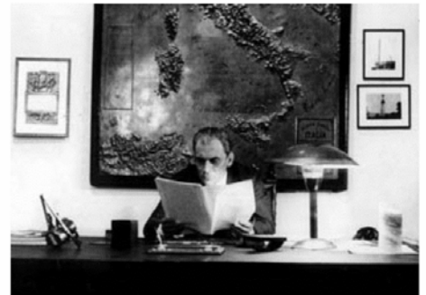
Il più grande tributo mai proposto al talento di Gian Maria Volontè con 75 appuntamenti

La festa del cinema a Bari, 300 eventi in 8 giorni. Nel nome di Volontè