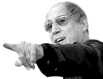
CELENTANO Atteso il 20 marzo

condotta da Laura Morante 23 marzo, ore 21