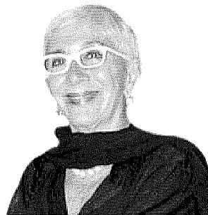
WERTMULLER Ricorderà la Melato