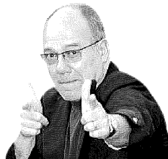
VERDONE Suo l'omaggio a Sordi