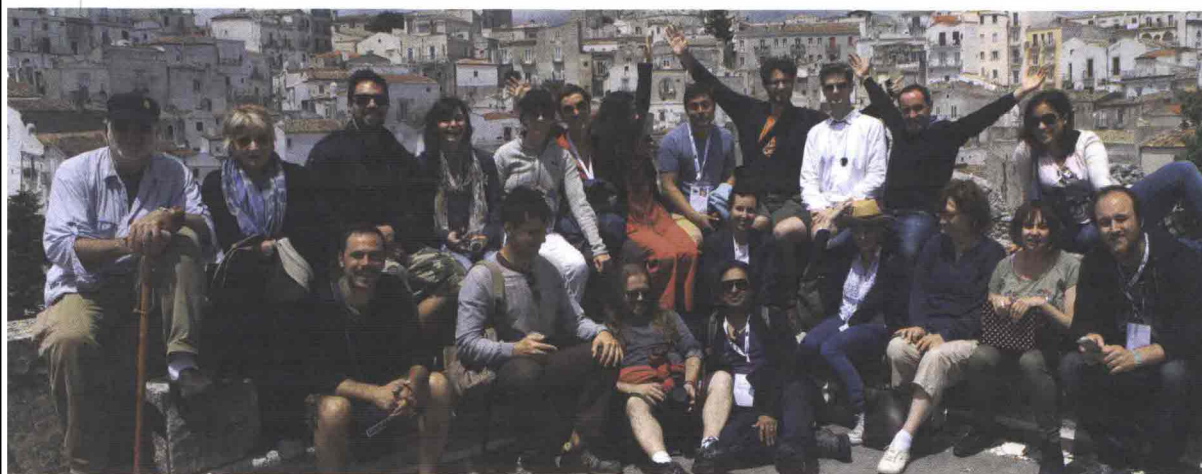
Da sinistra: un'immagine di "Anita B" di Roberto Faenza, girato in Alto Adige, e due immagini dei partecipanti di Puglia Experience