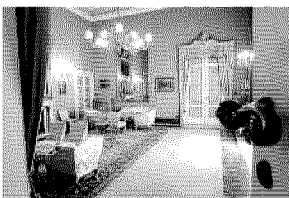
LA PREFETTURA Il 10 marzo visite col Fai