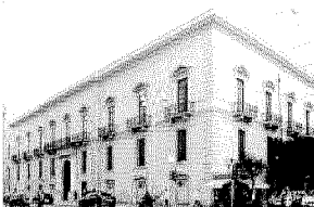
PALAZZO BARONE FERRARA Il 23 e 24 marzo l'apertura