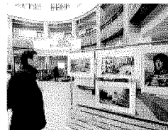
La mostra alle ex Poste

“OLTRE il giardino: una piazza una città (piazza Umberto I, identità sociale e identità politica nella città di Bari)” è il titolo della mostra iconografica per il bicentenario del quartiere Murattiano che sarà presentata in anteprima questa mattina, a mezzogiorno, negli spazi dell'ex Palazzo delle Poste, in piazza Cesare Battisti a Bari. La rassegna multimediale è curata da Daniele Trevisi ed è organizzata dal servizio Biblioteca e Comunicazione Istituzionale del Consiglio Regionale della Puglia, "Teca del Mediterraneo", in collaborazione con l'Università degli Studi 'Aldo Moro' di Bari e la Fondazione Borgo Murattiano. Resterà aperta fino al 12 marzo dalle ore 8 alle 20, con ingresso libero, e raccoglie attraverso decine e decine di immagini le testimonianze di come piazza Umberto sia stata l'agorà di una generazione in rivolta, dal '68 al '77 e fino agli ultimi fuochi della protesta studentesca negli anni Ottanta.