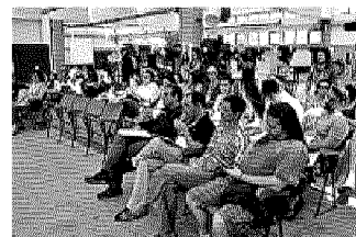
La platea del Cineporto