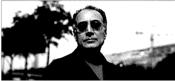
Abbas Kiarostami (a sinistra) e Carlo Lizzani a Bari per il Bif&st