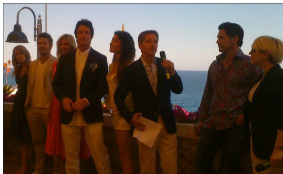
Un momento della conferenza stampa di stamattina

Di certo però è che è la Puglia a fare da testimone al fatidico e ancora incerto sì. I due attori insieme a Ridge (Ronn Moss), Brooke (Katherine Kelly Lang), Stefy (Jacqueline McInnes Wood), e Bill Spencer (Don Diamont) sono arrivati la scorsa domenica alla Masseria San Domenico di Fasano per girare dieci episodi che vedremo sui nostri schermi la prossima primavera. Polignano a Mare, Alberobello e Fasano le location prescelte, che hanno letteralmente conquistato la produzione e gli attori americani. Un pubblico numeroso e in larga parte protagonista come figuranti e comparse ha affollato, domenica sera, una delle scene principali girate sul ponte e sulla scalinata più famosa della città di Domenico Modugno. Mentre questa mattina i protagonisti hanno incontrato la stampa per raccontare impressioni e sensazioni di questi primi giorni in Pu-