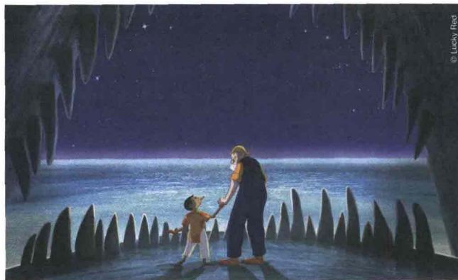
IN ALTO, PINOCCHIO DI ENZO D'ALÒ E UN GIORNO SPECIALE DI FRANCESCA COMENCINI, ENTRAMBI DISTRIBUITI DA LUCKY RED. SOTTO, UN GIORNO DEVI ANDARE DI GIORGIO DIRITTI, CHE SARÀ IN SALA PER BIM