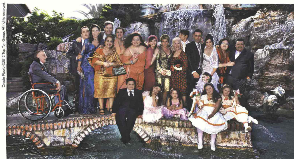
Oneste Picolo