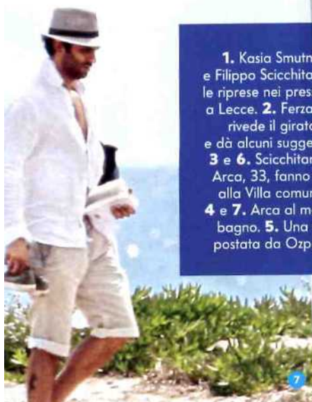
1. Kasia Smutniak, 33 anni, e Filippo Scicchitano, 19, durante le riprese nei pressi dell'Obelisco, a Lecce. 2. Ferzan Ozpetek, 54, rivede il girato al monitor e dà alcuni suggerimenti a Kasia. 3 e 6. Scicchitano e Francesco Arca, 33, fanno jogging vicino alla Villa comunale di Lecce. 4 e 7. Arca al mare, pre e dopo bagno. 5. Una scena del film postata da Ozpetek su Twitter.