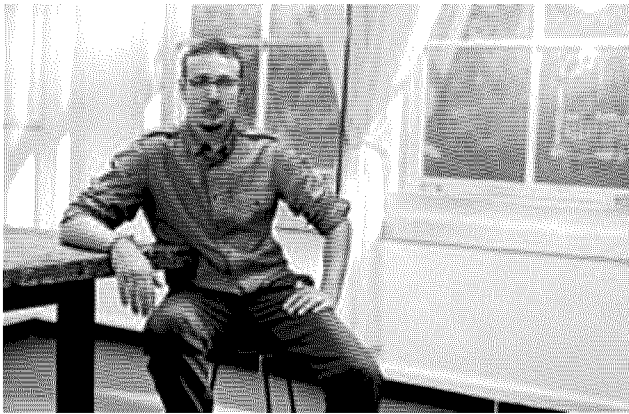
Minervini, il regista (italiano) del film americano «The Passage»