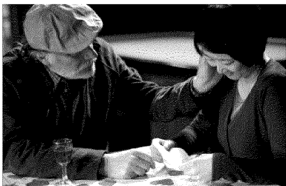
A sinistra una scena del film "Io sono lì" di Andrea Segre; a destra Serena Dandini che condurrà la serata finale di questa sera a partire dalle 20 al Teatro Petruzzelli